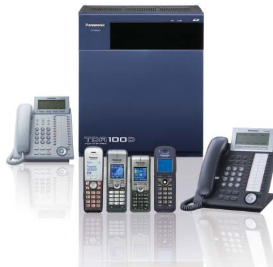
LINIA PRODUKTÓW KX-TDA100D

Centrala abonencka KX-TDA100D to platforma biznesowa rozwijająca się razem z przedsiębiorstwem. System jest gotowy do użytku z szerokim zakresem telefonów PSTN, linii PSTN, linii IP, telefonów IP, systemem CTI opartych na technologii IP oraz całą rodziną aplikacji do komunikacji biznesowej.