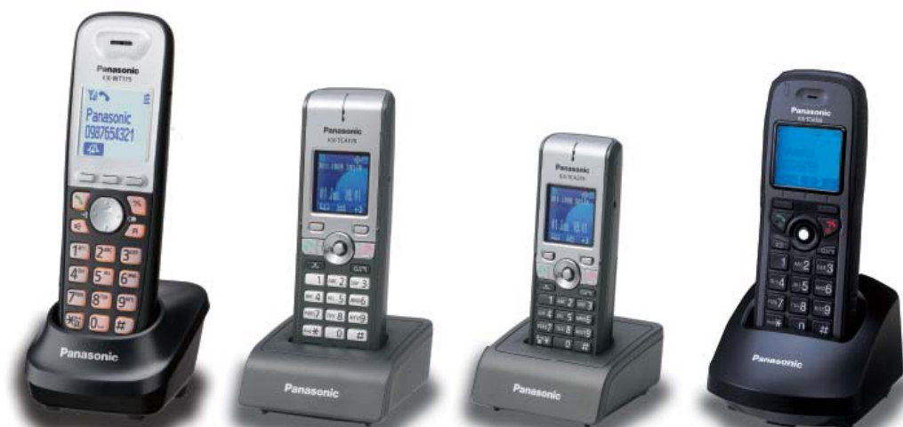
Model podstawowy KX-WT115