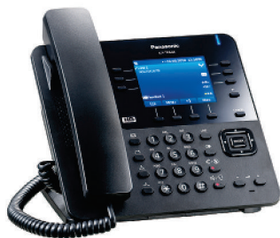
Telefon biurowy KX-TPA68