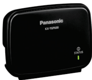
Jednostka bazowa KX-TGP600